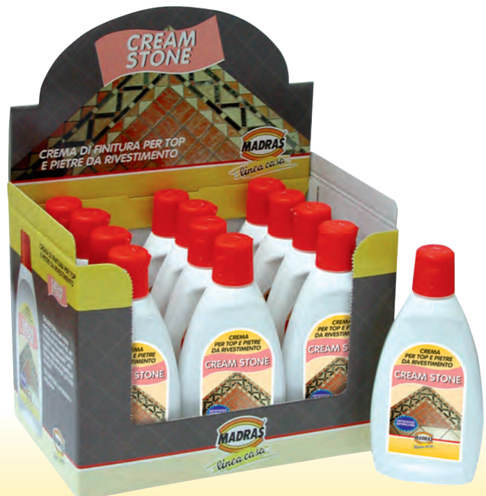
Espositore da banco