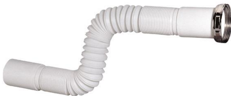
Immagine a puro scopo illustrativo.