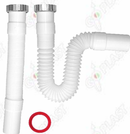
Immagine a puro scopo illustrativo.