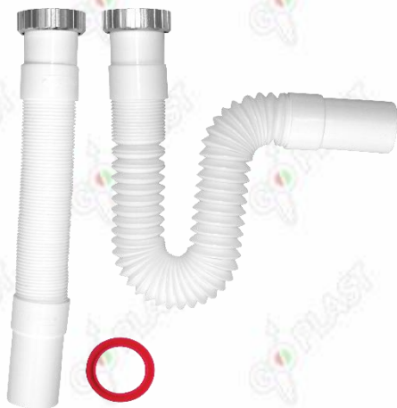
Immagine a puro scopo illustrativo.